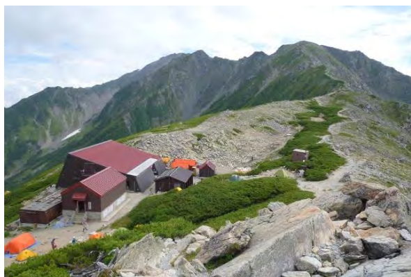
南アルプス 間ノ岳 (3,190m ; 2015年)

最近、さすがに高山の登行には体力の不安を感じてきたので、登山活動50年目の今年、全座登頂を果たして、「体力が要る登山」を卒業しようと考えていました。残念ながら新型コロナの発生でどうやら来夏に持ち越しになりそうです。今後も、健康維持のための山歩きを続けて行こうと考えています。