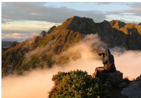
早朝の北穂高岳 (3,106m ; 2019年)