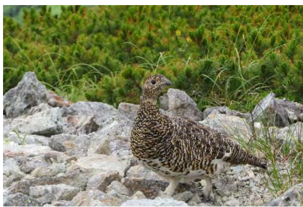
夏の雷鳥 (南岳 3,033m ; 2019年)