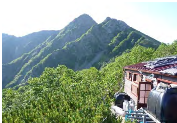
塩見岳 (3,047m ; 2016年)