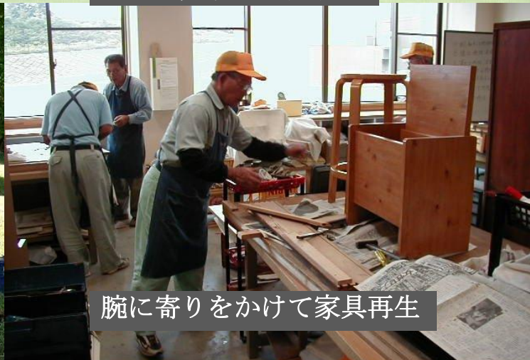
腕に寄りをかけて家具再生