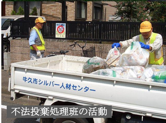
不法投棄処理班の活動