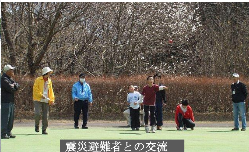
震災避難者との交流