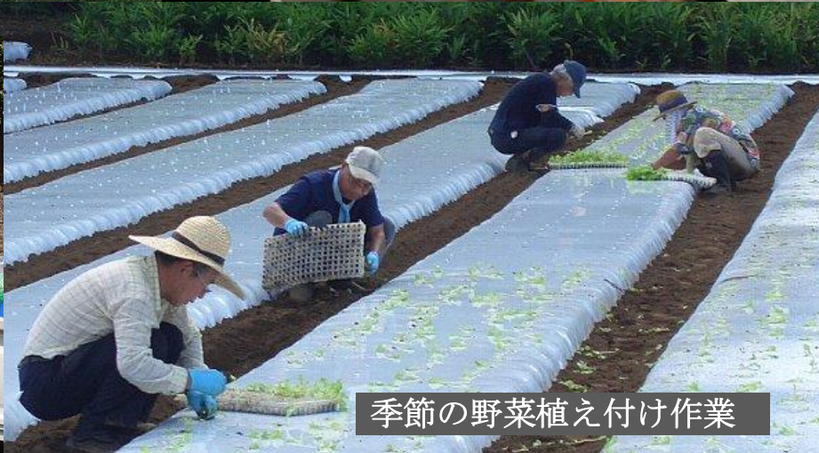
季節の野菜植え付け作業