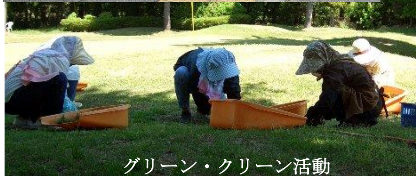
グリーン・クリーン活動