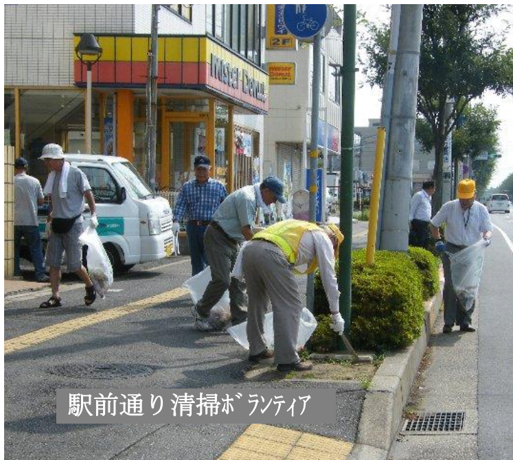
駅前通り清掃ボランティア