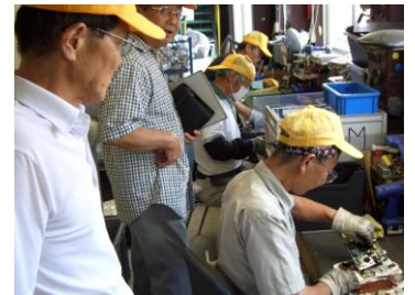
(有)エテック作業パトロール風景

つとして必ず着用するように依頼しました。又就業前にラジオ体操を行っている。(エテック) 作業中に 20 分に一度の水分補給の号令が掛かる、(タキ種苗牛久農場)といった就業先もありました。今は季節の変わり目、健康には十分留意し、「安全就業必携ハンドブック」を今一度読み返し作業に従事したいものです。次回のパトロールは真冬の時期ですが、元気な会員の皆さんとまた、お会いできるのを楽しみに、お互いに頑張りましょう。